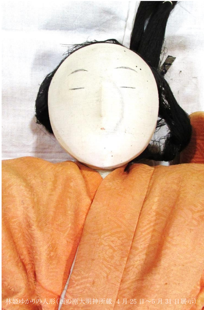
林姫ゆかりの人形(西の原大明神所蔵 4月25日～5月31日展示)