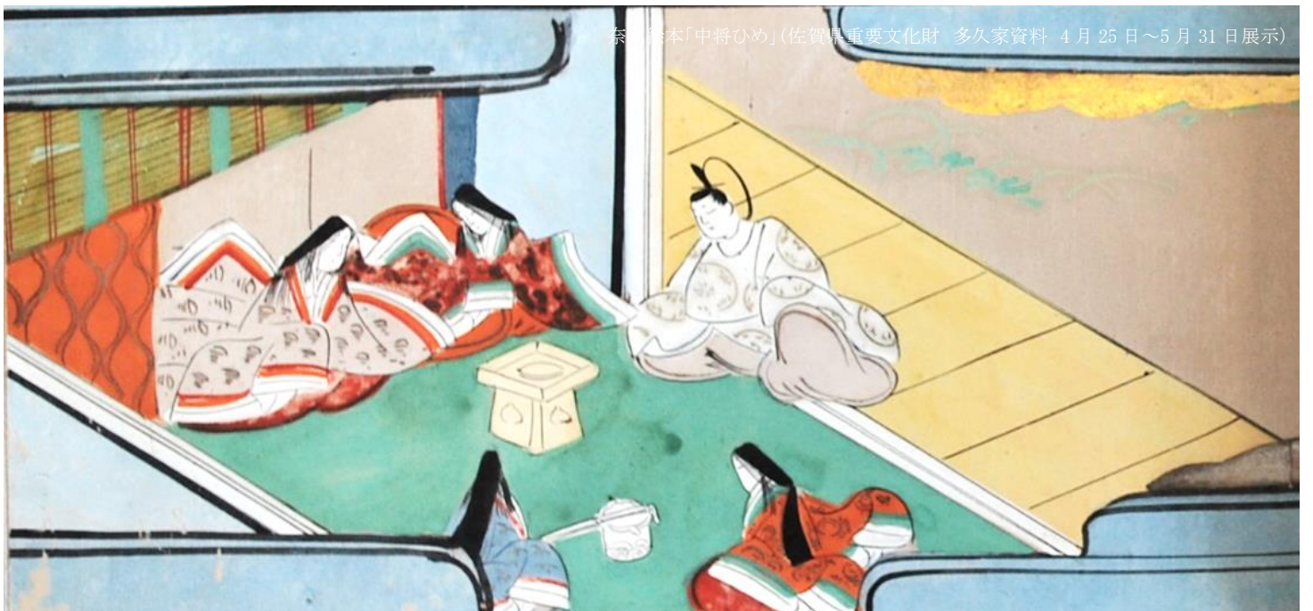
奈々絵本「中将ひめ」(佐賀県重要文化財 多久家資料 4月25日～5月31日展示)