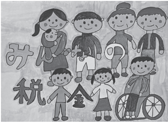
水田菜々美さんの作品 陣内こころさんの作品 浦田惺矢さんの作品