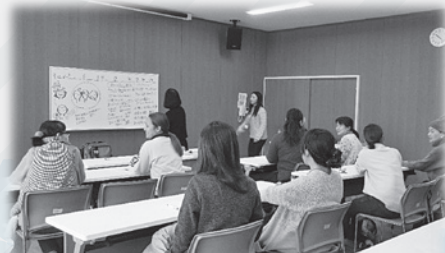
▲子ども役と保護者役に分かれてロールプレイする参加者