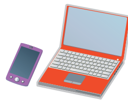
インターネット・ 気象庁ホームページ