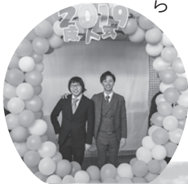
▲昨年の成人式のひとコマ