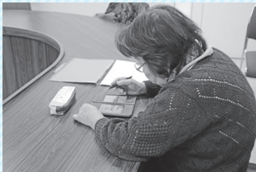
▲ゲーム機を使って脳トレ中