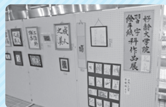
▲昨年(2018年)の作品展の様子