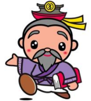
多久市観光公使 「多久翁さん」

多久市では、佐賀銀行、佐賀東信用組合、住宅金融支援機構と協定を締結し、移住・定住者の住宅ローンに対する支援を実施しています。以下の利用条件や利率の優遇制度があります。