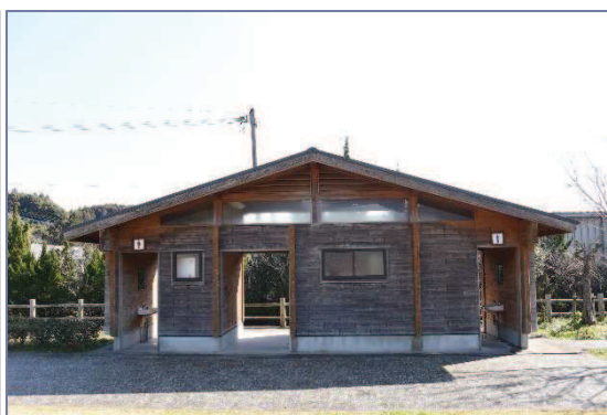
宝満山公園トイレ