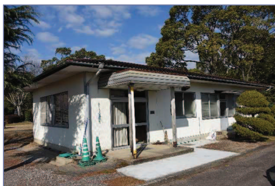
中央公園（管理事務所）