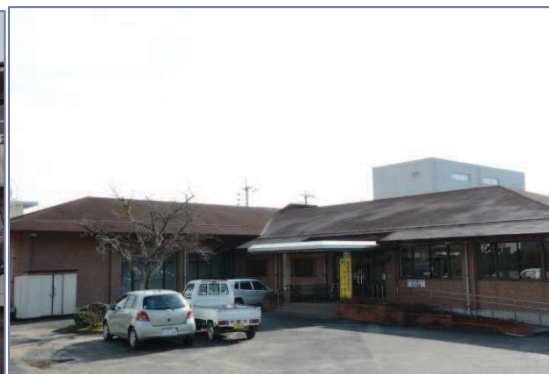
老人福祉センター