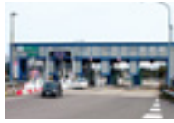
●多久インターチェンジ