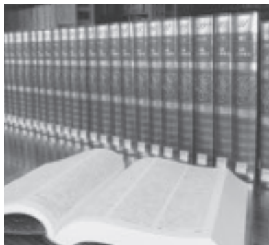
図解もある百科事典 (改訂最新版) 全31巻

多久市で執筆活動を続け、平成16年6月に亡くなられた、小説家の滝口康彦さんのご遺族から、図書の実のためにと寄付をいただきました。その寄付を活用し市立図書館では「平凡社大百科事典」や「佐賀県史料集成」などの新しい本を揃えました。ぜひ、ご利用ください。