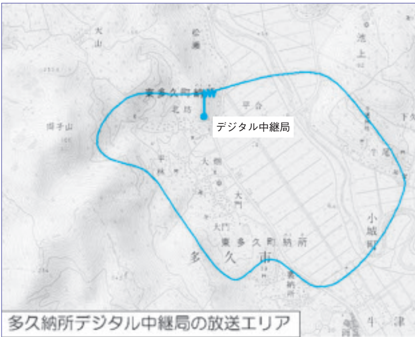
多久納所デジタル中継局の放送エリア

東多久町納所付近をサービスエリアとする「多久納所デジタル中継局」が、6月1日に開局します。