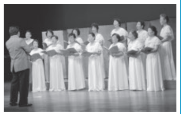
▲素敵な歌声のコーラスいずみのみなさん