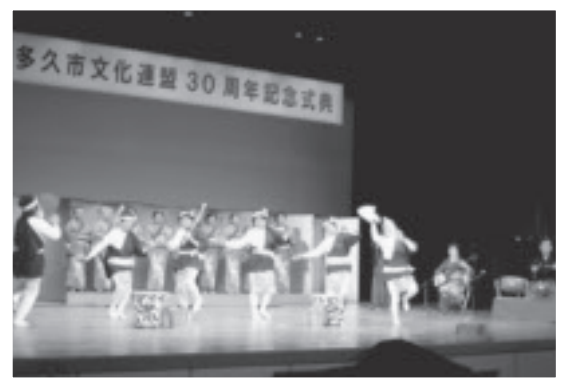
◀餅つき踊りは祝いの舞台にぴったり