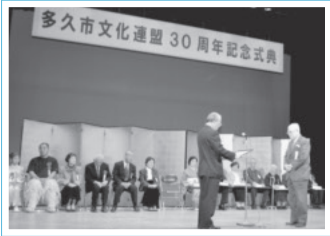
◀晴れの特別功労賞表彰の授与式