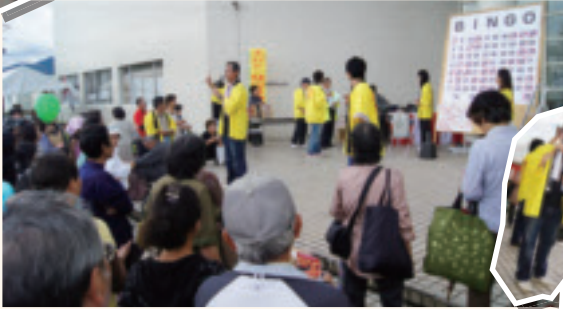
おいでんさいカード店会主催 ビンゴゲーム