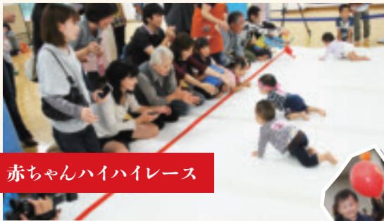
赤ちゃんハイハイレース