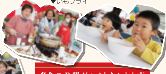
多久のB級グルメうまかもん市