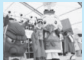
佐賀バルーンフェスタ