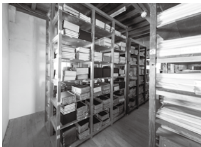
▶資料の保管状況(郷土資料館)