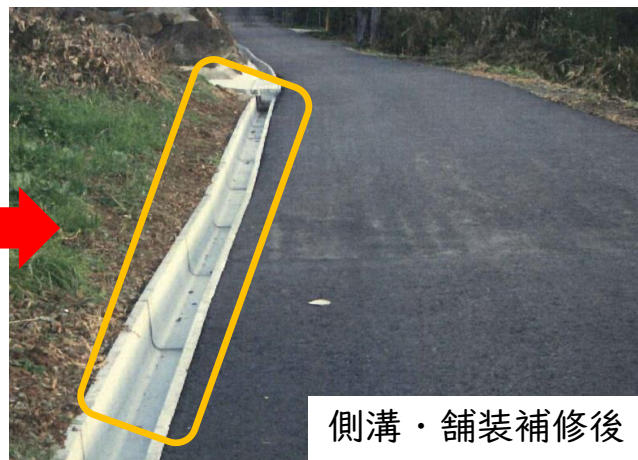
側溝・舗装補修後