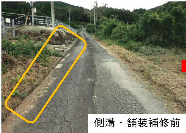
側溝・舗装補修前

公共施設等の老朽化対策は全国的に大きな課題になっており、多久市においても個別施設計画に基づき、安心安全な交通環境を確保するために、舗装・側溝・道路照明の計画的な補修、更新を行い施設の長寿命化を図ります。