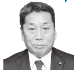
渡島 幸司 議員