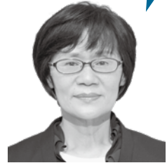
坂口 絹代 議員