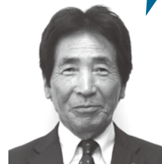
田淵 厚 議員

答弁 厳しい財政状況が続く中で、老朽化対策は大きな課題と認識しています。市民のみなさんの利便性を配慮しつつ、公共施設の最適な配置と魅力ある施設へと変化させていきます。