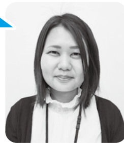
生活支援コーディネーター かわさき 川崎