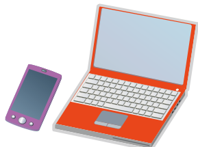
インターネット・気象庁ホームページ