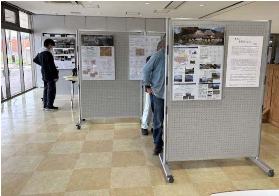
パネル展の様子(あいぱれっとに於いて)