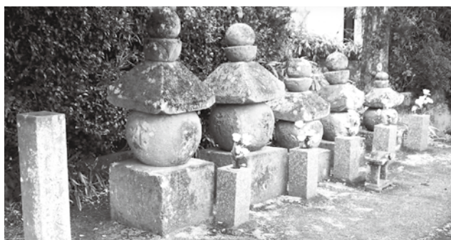
◀多久市重要文化財 前多久家石造供養塔 （南多久町延寿寺境内）