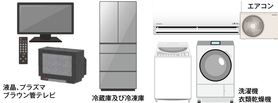
液晶、プラズマ ブラウン管テレビ

家電リサイクル法により以下の家電4品目は消費者から販売店などを経て製造業者に引き取られリサイクルされています。