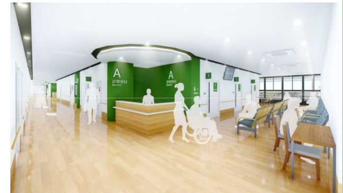
公立佐賀中央病院イメージ