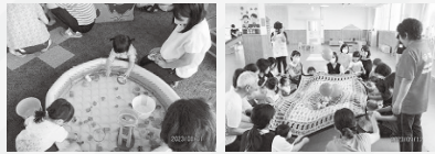
▲水あそびのようす ▲レクリエーションのようす

日時：原則毎週火曜日（祝日の場合は水曜日） 10時30分～11時30分 内容：講師によるミニ講座や読み聞かせ、お誕生会、季節の工作など