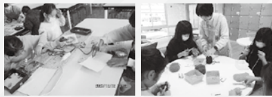
▲クリスマス工作のようす ▲毛糸で遊ぼうのようす

日時：原則毎週土曜日 14時30分～15時 定員：10人 内容：工作やビデオ上映会など