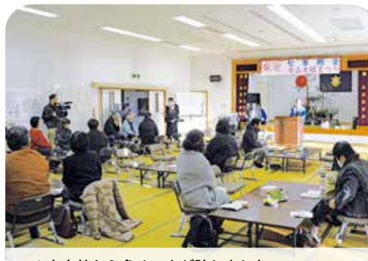
▲市内外から多くの人々が訪れました

鬼火焚き・七草粥会・女山大根まつり（主催：西多久町を考える会）が宝満山公園と西多久公民館で行われ、市内外から約100人が参加しました。