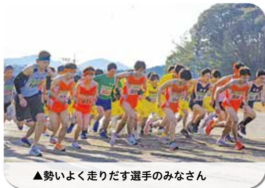
▲勢いよく走り出す選手のみなさん

第59回多久市成人祝賀ロードレース大会（主催：多久市、多久市教育委員会、一般財団法人多久市体育協会）が多久市陸上競技場周辺で開催されました。