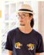
ヤマガミユキヒロ (現代美術家)

多久市と noh play 製作チームが共同で「noh play」を開催します。「noh play」とは、日本の伝統芸能の一つである能楽と現代美術が融合した現代美術家ヤマガミユキヒロ氏の代表的な作品です。これまで京都と札幌でしか公演されていない作品を多久市で開催します。能の演技には、京都の実力派能楽師林宗一郎氏を迎え、豪華キャストでお届けします。