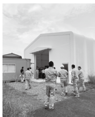
文化財埋蔵物 収納テント倉庫新築工事