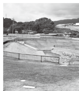
地域振興対策事業 スポーツ・レクリエーション施設 整備等工事