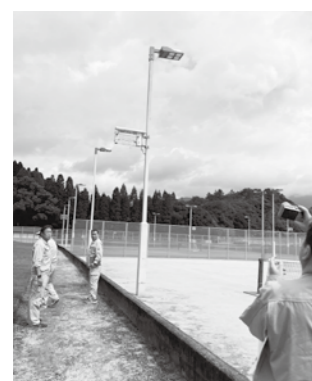
庭球場照明設備改修工事