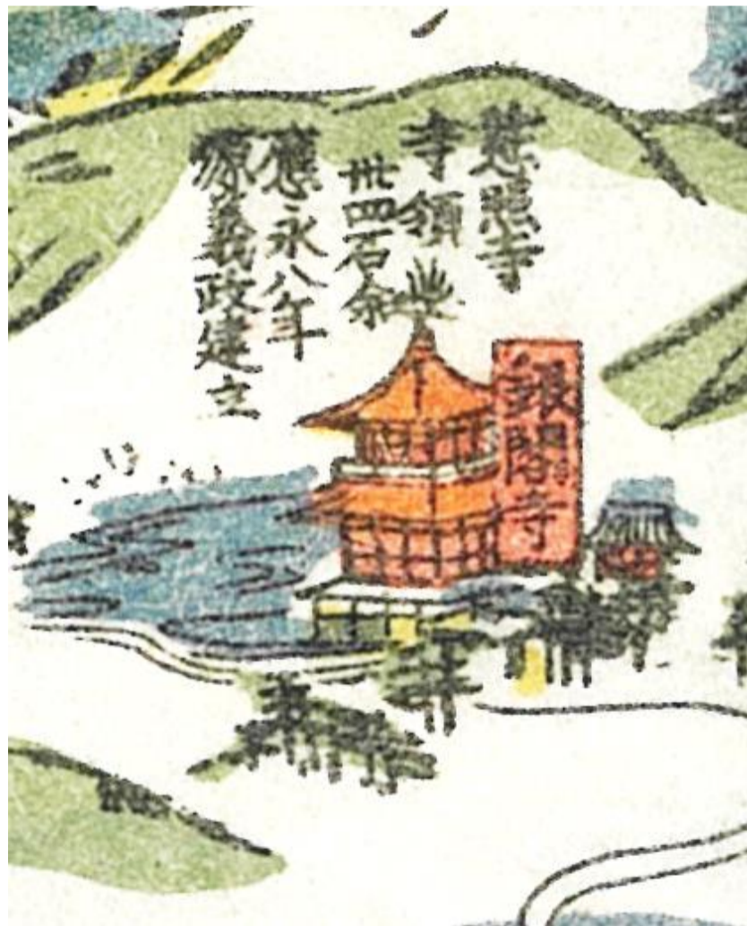
京町御絵図細見大成 慶應四(1868)年 多久市個人蔵 部分

日時 令和5年10月1日(日曜)~令和6年3月31日(日曜) 9時00分~16時00分 休館日 月曜日 ※月曜日が祝日の場合は開館し火曜が休館日 ※12/29~1/3 休館 場所 多久市郷土資料館 第3展示室 多久市多久町 1975 番地(西溪公園内) 電話・ファクシミリ 0952-75-3002 その他 入場無料