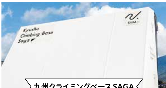
九州クライミングベース SAGA

多久高校の敷地内に新たにスポーツクライミング競技施設が建設されています。先行してボルダーエリアは完成。さらにリード競技、スピード競技で使用するエリアも完成間近です。3競技全てを行うことができる施設は九州唯一で、国際的な大会の開催も可能となります。