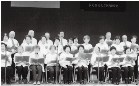
過去の「すこやか長寿祭」