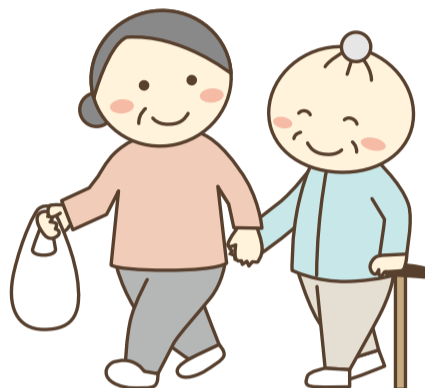
通院や買い物の付き添い