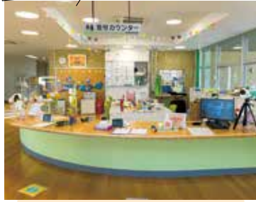
来館したら、受付で必要事項を記入してください。