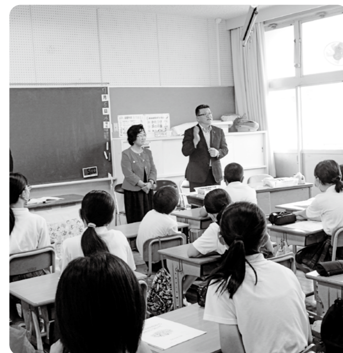
▲東原彦舎西溪校の出前授業の様子