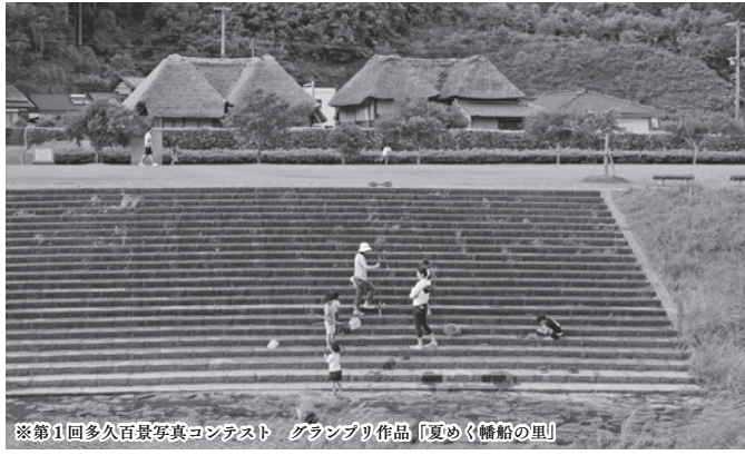
※第1回多久百景写真コンテスト グランプリ作品「夏めく橋船の里」

あなたの写真が多久百景に 多久市は佐賀県の真ん中にある史跡の町。そこで、「多久の四季・伝統文化・歴史」をテーマに写真コンテストを開催し、5年計画で計100作品を集めて『多久百景』を創ります。あなたが素敵と感じる多久の風景をお寄せください。