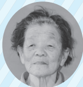
くもん 公文 タケノさん