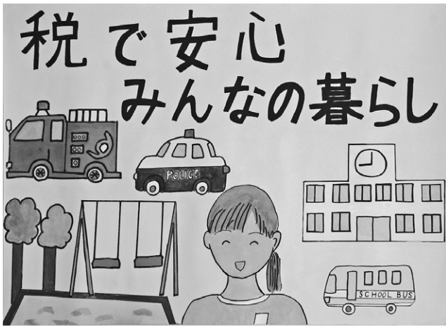
▶ 尾鷲娃娃さんの作品