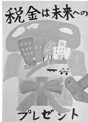
▶ 徳島唯さんの作品