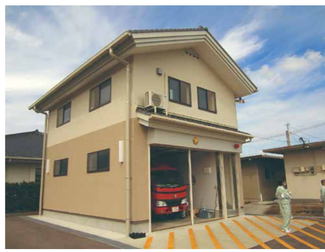
南多久分団本部車庫新設工事