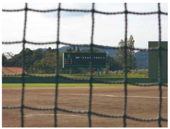
野球場スコアボード改修工事