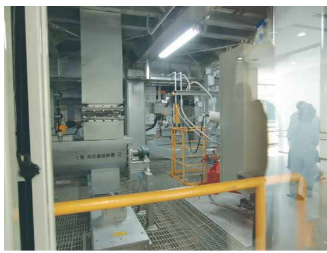
天山地区共同環境組合負担金（クリーンヒル天山）