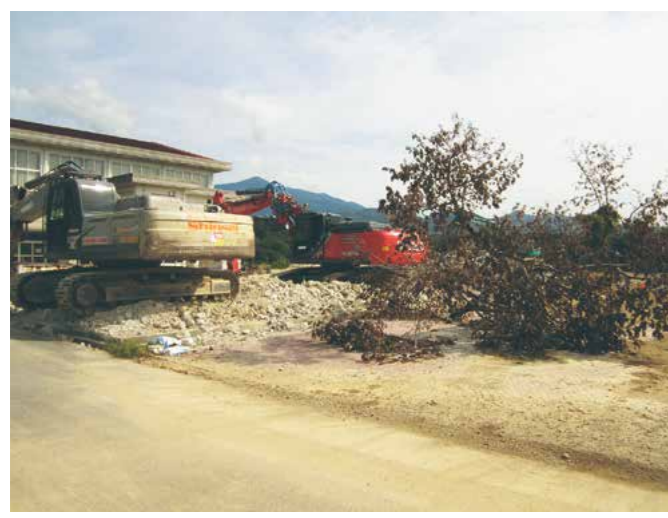
旧緑が丘小学校解体工事