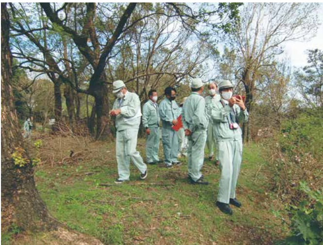
観光施設維持管理(鬼の鼻山園地)