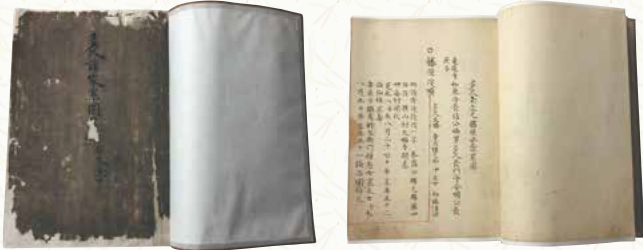
草場佩川に命じて編集した「多久諸家系図」全7巻