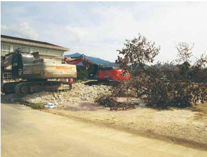
旧緑が丘小学校解体工事