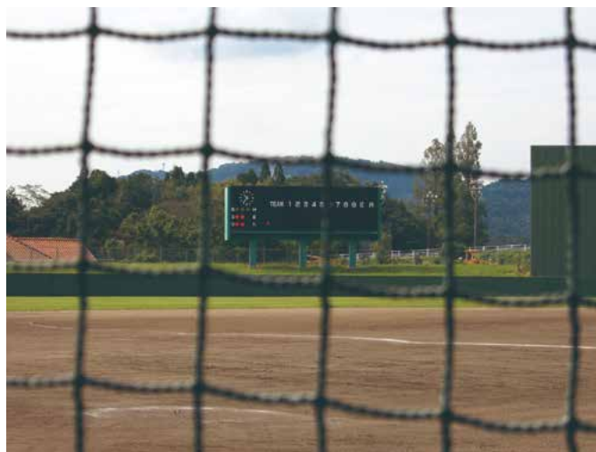
野球場スコアボード改修工事