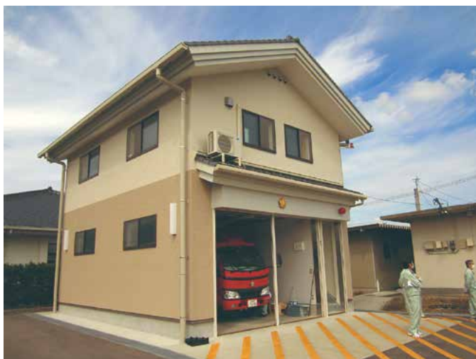
南多久分団本部車庫新設工事