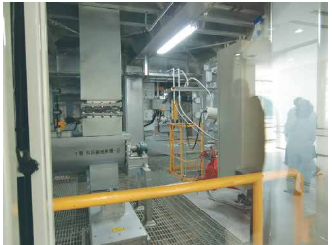
天山地区共同環境組合負担金(クリーンヒル天山)