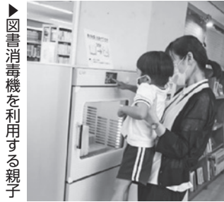
▶ 図書消毒機を利用する親子

市立図書館を利用するみなさんが、安心して読書に親しむことができるよう、貸出用書籍を消毒処理できる装置を導入しました。装置は一度に6冊を紫外線で消毒処理し、同時に風をあて、ホコリや髪の毛なども除去できます。